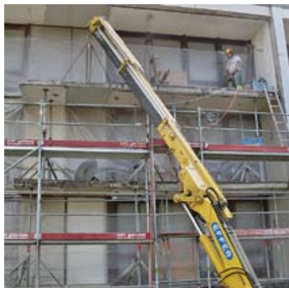
Trieschweg Buchs: Abtrennen